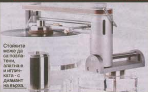
Стойките може да са позлатени, златна е и игличката - с диамант на върха.

Извънземната машина Statement тежи 350 кг. и включва всички възможни технологии за уреда