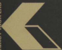
ТОНКОЛОНИ, СТЕРЕО СИСТЕМИ